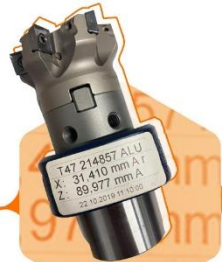
Label mit Messwerten und Zeitstempel