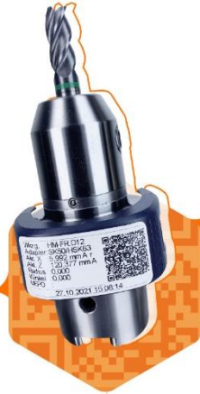
QR-Code auf Label mit digitalisierten Messwerten