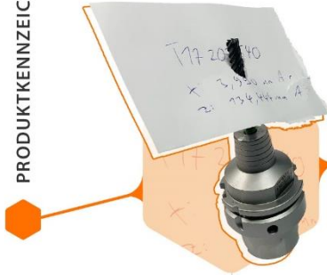
Angehänger Zettel mit handschriftlichen Messwerten